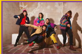
COLLECTIF MEDZ BAZAR