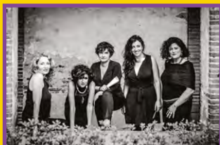
LES DAMES DE LA JOLIETTE

[Musique métissée Tibet / Iran / Europe du Nord]